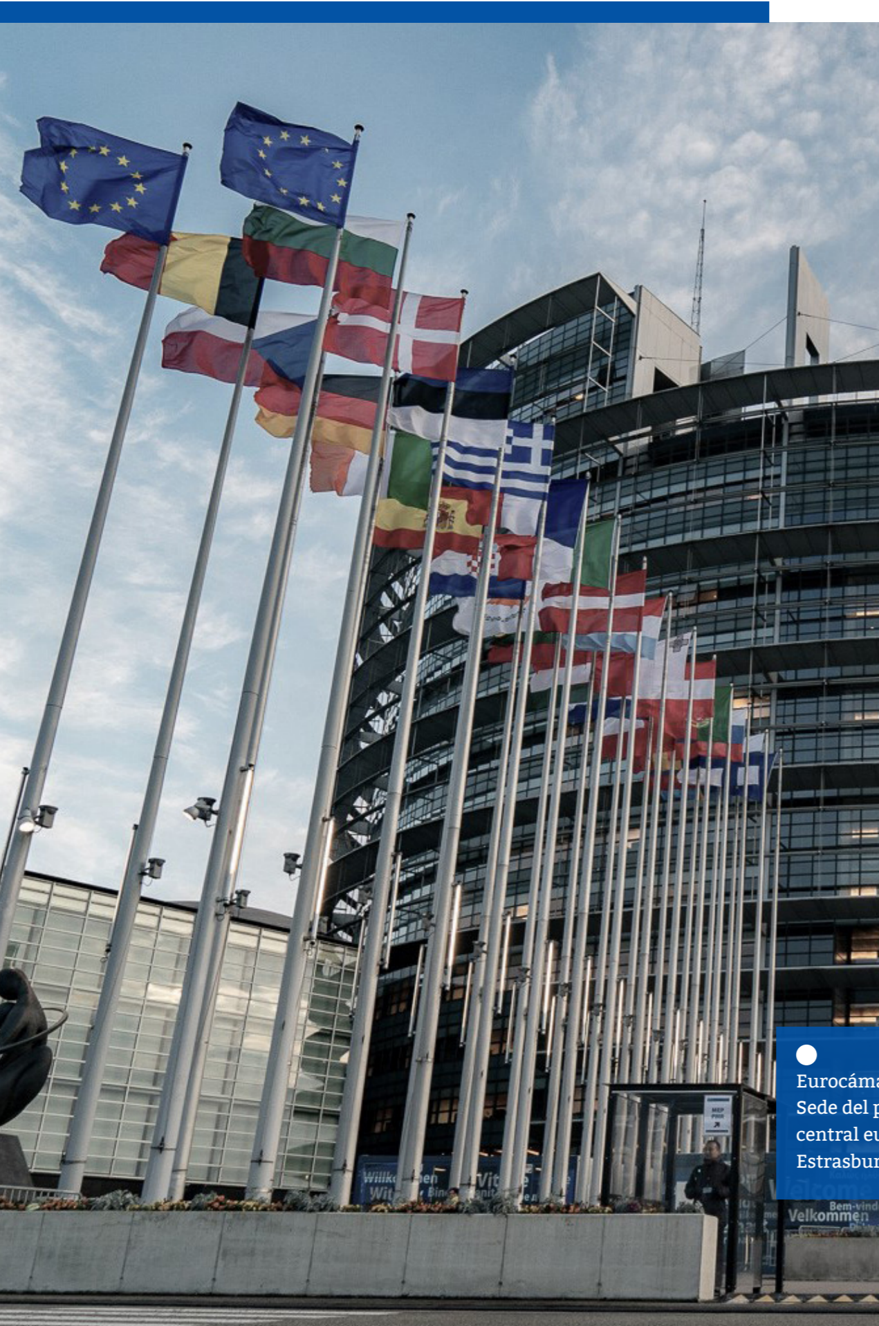
● Eurocámara Sede del parlamento central europeo. Estrasburgo, Francia.