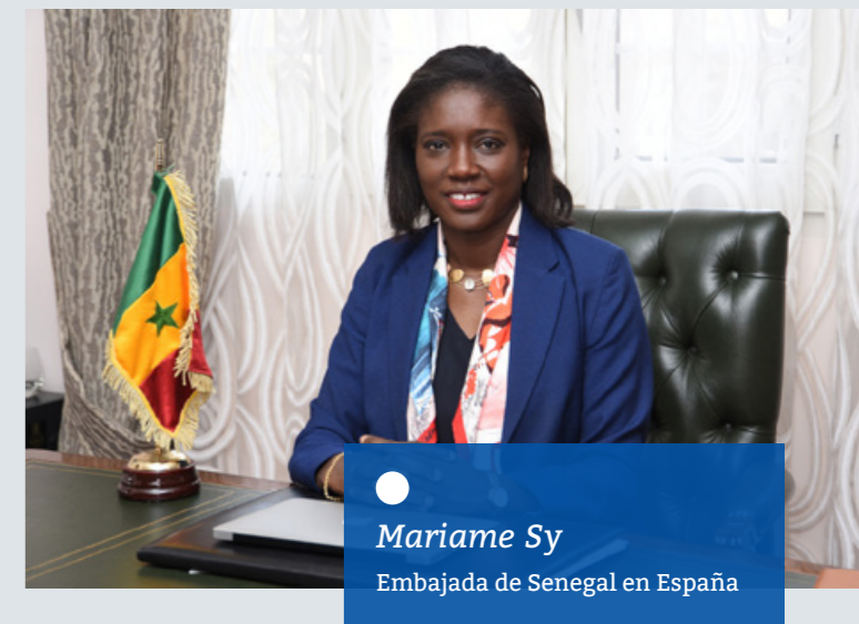
Mariame Sy Embajadora de Senegal en España

Debemos tener en cuenta que el posicionamiento geográfico de Senegal es también muy estratégico porque el país se encuentra cerca de Europa y no está lejos de América. Adicionalmente, la estabilidad del país se basa en sus buenas infraestructuras, una buena red de comunicaciones y altos niveles de seguridad , lo que nos facilita poder acoger, fácilmente, eventos institucionales y de negocios en Dakar.