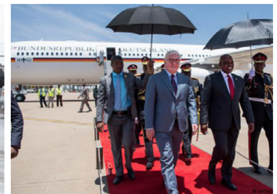
Recepción en pista del presidente de la república alemana | DW | 11.04.2019

Dassault Falcon 900. La segunda, el 402 Escuadrón, solo opera helicópteros, con una flota compuesta por varios Eurocopter AS332 Súper Pluma y Eurocopter AS532 Cougar. Ambas unidades del ejército tienen base en Torrejón de Ardoz (Madrid).