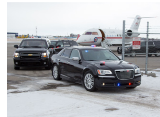
Salida de motorcade tras una recogida en pista de una delegación presidencial | 18.01.2020

Desde que en 1962 el presidente John FitzGerald Kennedy, más conocido como JFK, se convirtiera en el primer presidente en volar en un jet construido específicamente para su uso como avión presidencial, se han sumado otros muchos presidentes de gobierno alrededor de todo el mundo. De hecho, la práctica totalidad de los países del mundo utilizan a día de hoy, aeronaves de uso exclusivo para vuelos presidenciales.