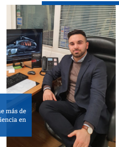
CIMA Luxury tiene más de 60 años de experiencia en estos viajes.

Sin embargo, armándonos de paciencia, confianza y dedicación hemos podido capear el temporal y saber esperar tiempos mejores, que ya están llegando. Ahora parece verse la luz al final del túnel y, por fin, tenemos total libertad para hacer lo que más nos gusta: trabajar y dar un gran servicio a nuestros clientes.